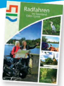
Broschüre über Onlineshop erhältlich